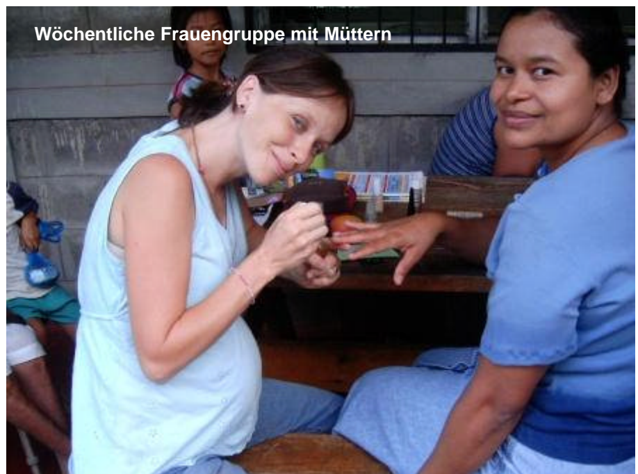
Wöchentliche Frauengruppe mit Müttern

Am vergangenen Samstag veranstalteten wir auf unserem Schulgelände einen Missionsbazar, an welchem wir verschiedene internationale Gerichte kochten, einen Flohmarkt organisierten und sportliche Aktivitäten anboten. Es war ein gut besuchter, fröhlicher Anlass.